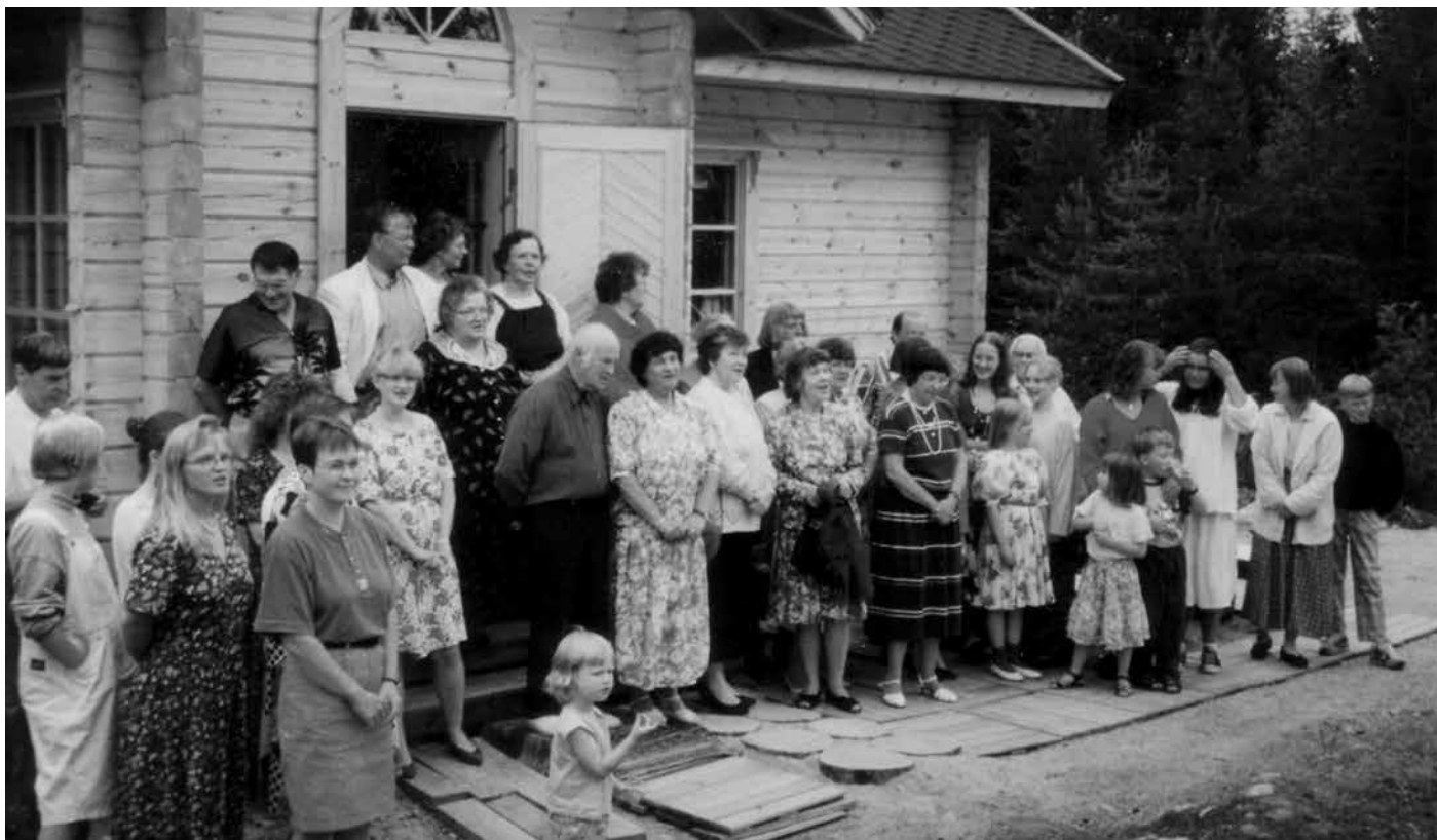
Runsaasti sukulaisia Jennynkallion sukumuseolla 1990-luvulla.