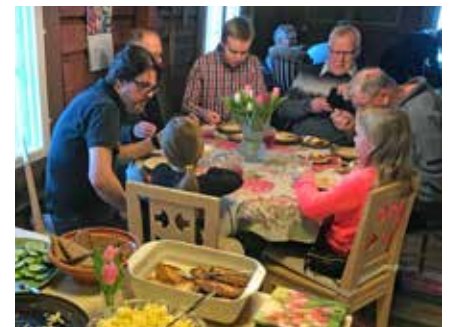
Menneiden muistelemisen ja sukujuurien setviminen sujui rattaosasti hyvän ruuan ääressä.