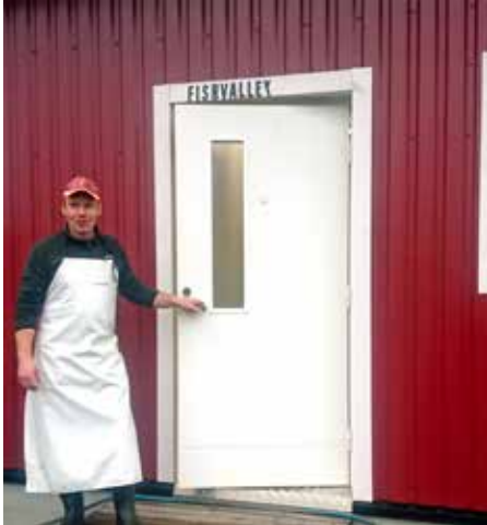
Nykyaikainen tuotantorakennus toimii ja täyttää viranomaisvaatimukset.

Kalastus on ympärivuotista. Markkina-alue painottuu kalatukun kautta Uudellemaalle. Lisäksi kalaa toimitetaan suoraan ravintoloihin sekä yksityisille asiakkaille. Kalaa myydään myös erilaisissa toritapahtumissa, sekä tuoreena että paistettuna.