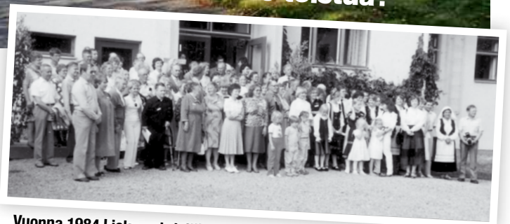
Vuonna 1984 Lieksan kristillisellä opistolla Kylänlahdessa oli 110 Kotilaista koolla; Amerikkaa myöten.

Miten olisi risteily pitkin Pielistä Kolin kansallispuistoon, luontokeskukseen ja kylpylään Lieksan laiturista, noin 16 kilometrin päästä?