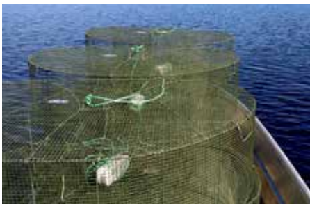
Ammattikalastus Kivijärvellä vaatii ammattilaisen työvälineet.