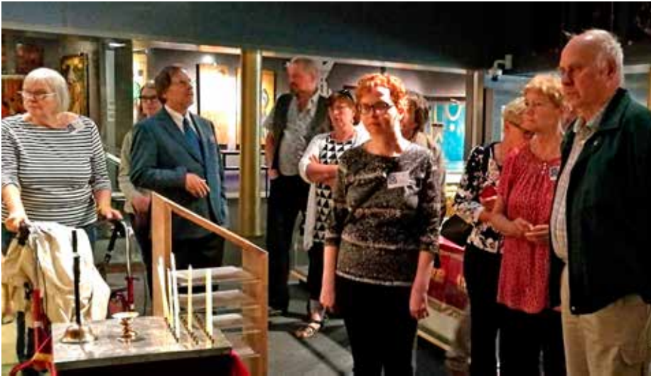
Osa sukua tutustui Riisaan, Suomen ortodoksisen kirkkomuseoon. Museossa kohtaavat karjalais-ortodoksinen kulttuuriperintö ja vuosituhantinen bysanttilainen traditio.