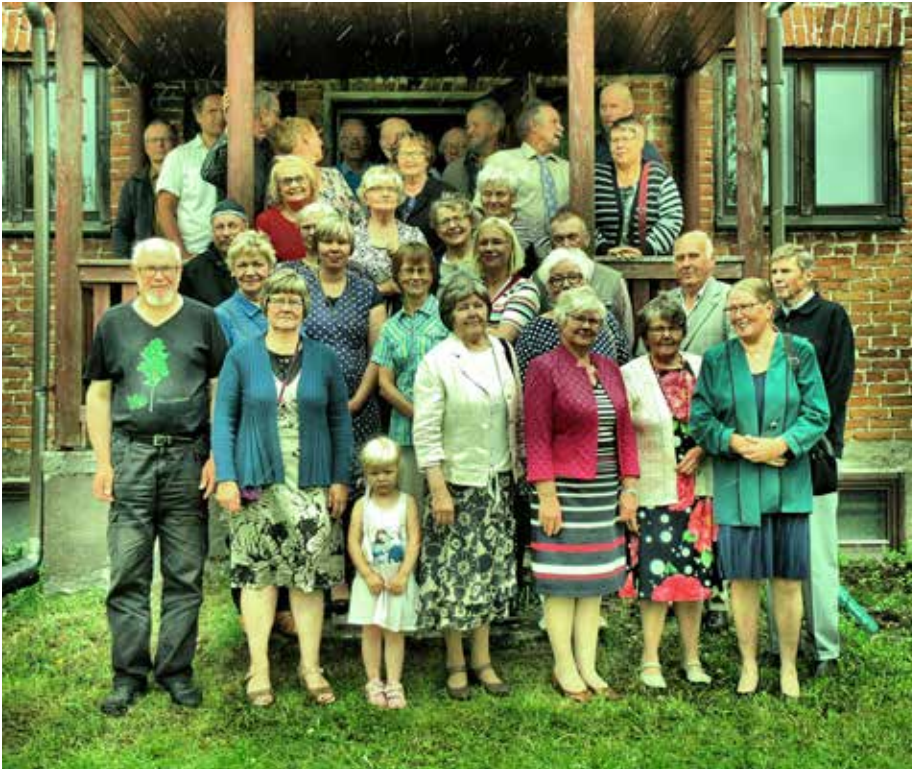
Liki neljäkymmentä Koiramäen Kotilaisista polveutuvaa sukulaista kokoontui Kirmanrannan Purolan taloon. Talo oli yksi Koiramäeltä lähteneiden Kotilaisten asuinpaikoista jo 1800-luvulla.