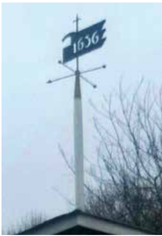
Sukutilaviiri on edelleen kunniapaikalla Puralan pihapiirissä, vaikka rakennuksia on uudistettu. Vuosiluku on 1636.