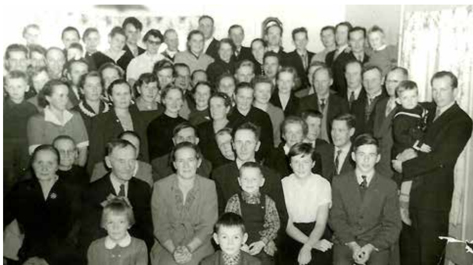
”Juhlaväkeä kertyikin kaikkiaan 69-henkeä. Olin varannut vahakantisen vihkosen, johon jokainen kirjoitti nimensä, osoitteensa ja syntymäaikansa.”