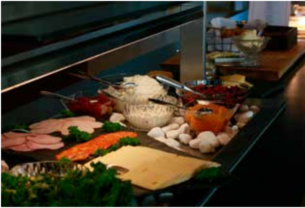
Maittava hotelliaamiainen sisältyy huoneen hintaan. Majoitus-huone on varattava ja maksettava itse totuttuun tapaan.