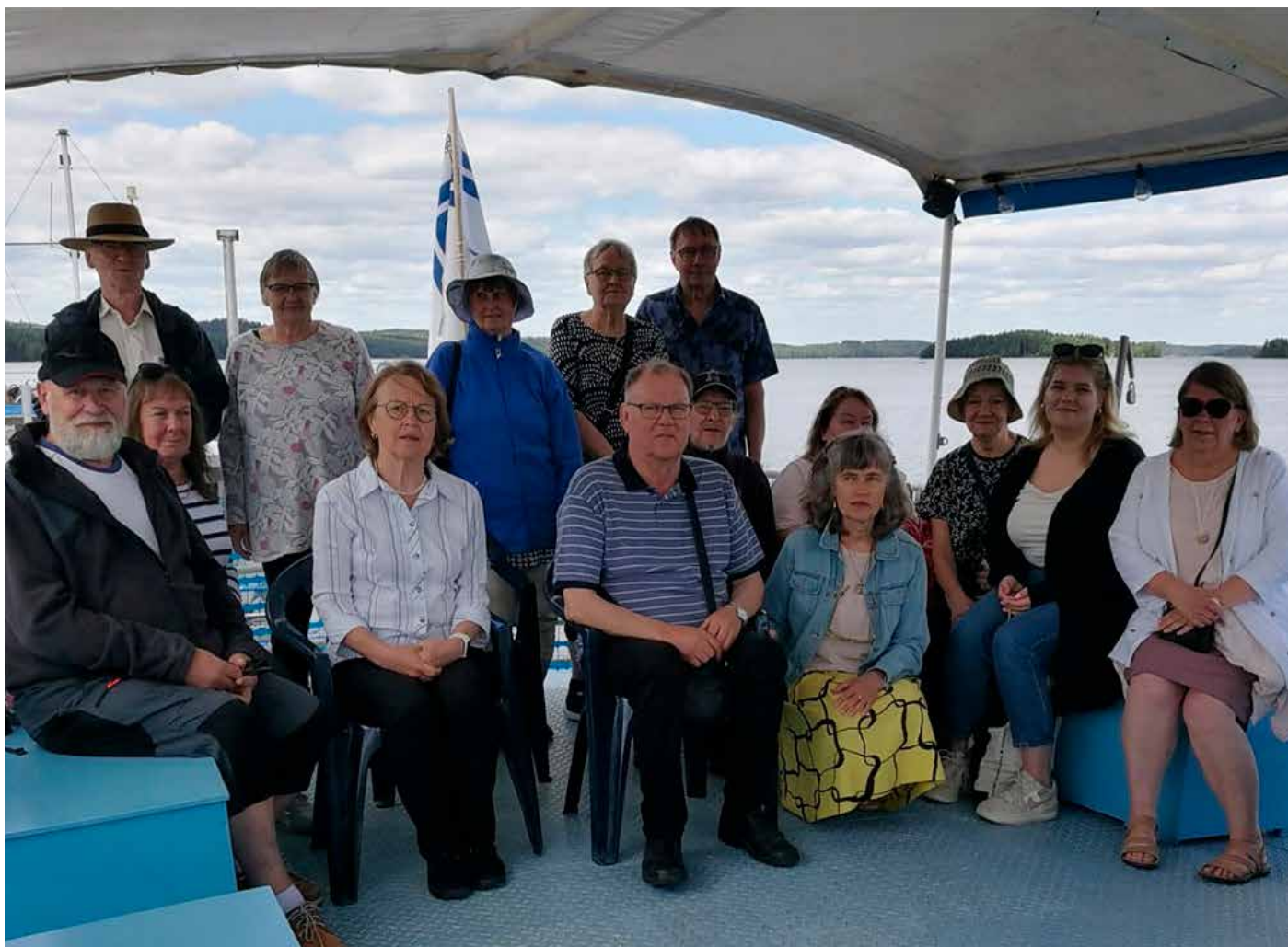
Osa risteilyvieraista osui samaan kuvaan. Sää oli hieman viileä.

oli syntynyt, missä nykyisin asuu ja mitä sukuhaaraa edustaa.