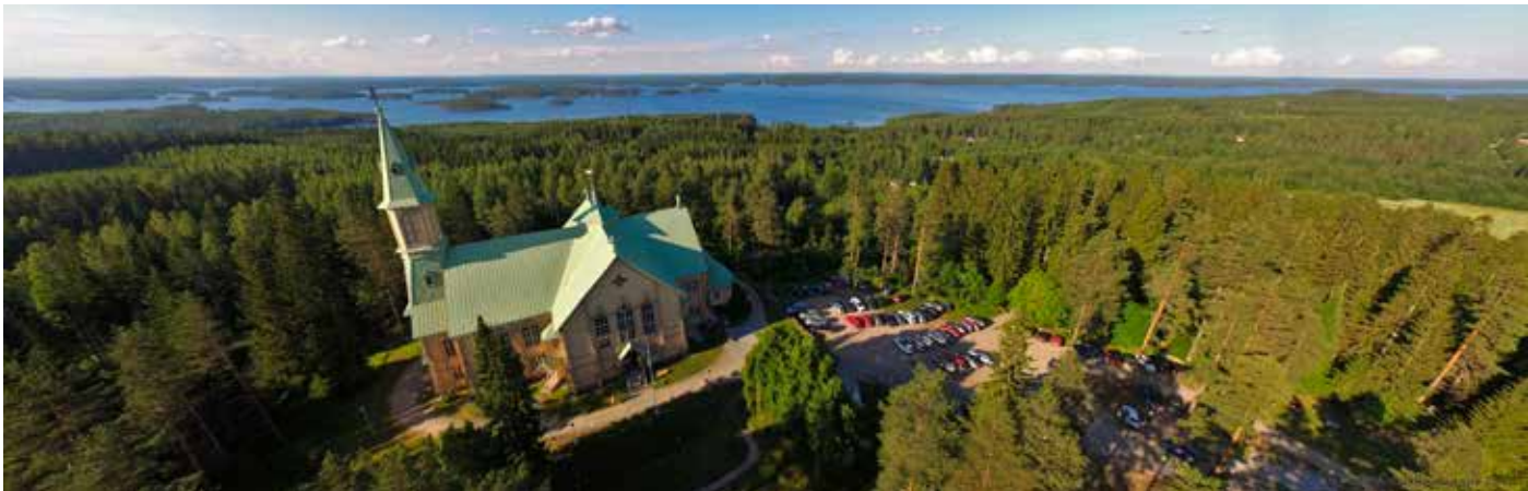
Heinäveden Musiikkipäivät esiintyvät Heinäveden uusitussa kirkossa, mutta sen lisäksi muuallakin, ympäri Suomea.