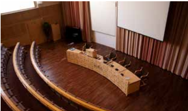
Tilava auditorio odottaa kokousväkeä ja esiintyjä. Piano on viritetty laulajia varten.

Majoitusrakennuksia on kaksi, päärakennus ja suurten, ajat-tomien mäntyjen jakaman pihan toisella sivustalla vanhempi rakennus, joista majoittuja voi valita mieleisensä yli 40:n pää-asiassa kahden hengen huoneen valikoimasta.