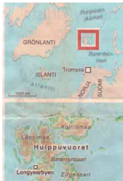
Huippuvuoret ovat todella Pohjoisessa!