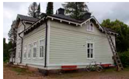
Pulsan rautatieasema, jossa serkkujemme tapaaminen alkoi.