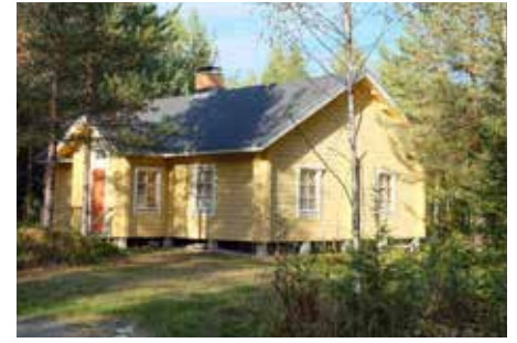
Syksy saapuu. Museo valmistuu lumen tuloon.