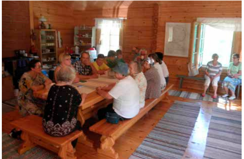
Sukumuseolla on käyttöä. Tällaisia sukulaisten kokoontumisia Jennynkallion museon tuvassa on ollut joka kesä; myös kuluneena kesänä.