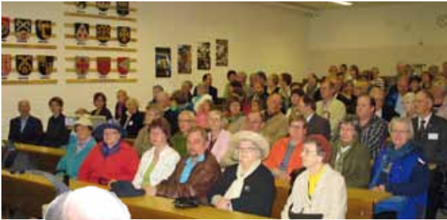
Suku perehtyi keskittyneenä Pohjois-Karjalan Prikaatin toimintaan.