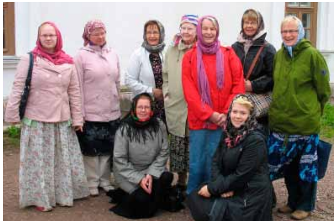
Kuten näkyy, seurueemme naiset olivat pukeutuneet asianmukaisesti.

Taidegallerian jälkeen kävimme Kolmikulmapuistossa katsomassa Runonlaulajapatsasta ja Kuhavuorella ihailmassa kaupunkinäky- miä.