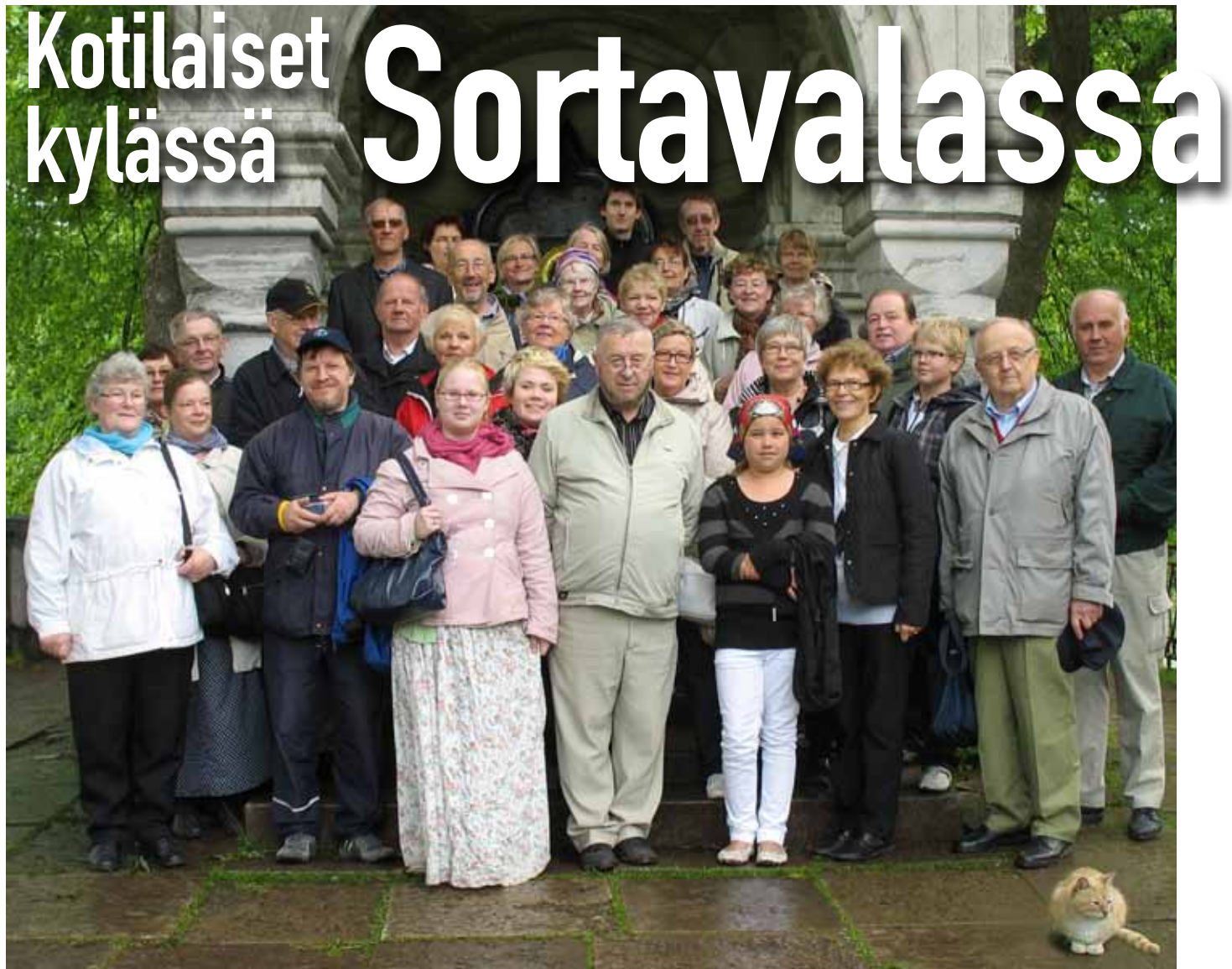
VALAMOSSA. Kotilaisten seurue Znamenie-ikonin kappelin edessä. Myös paikallinen kissa halusi tulla kuvaan.

Kotilaisten sukuseuran virallinen vuosikokous ja rattoisa sukutapaaminen Joensuussa olivat sujuneet mukavasti, samoin vierailut Pohjois-Karjalan prikaatissa ja SF-Filmikylässä. Mutta ei siinä vielä kaikki. Sunnuntaina iltopäivällä 38 meistä jatkoi matkaa Sortavalan ja Valamon.