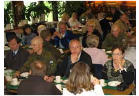
Sotkun perinteiset munkkikahvit maistuivat myös sukuseuralaisille.