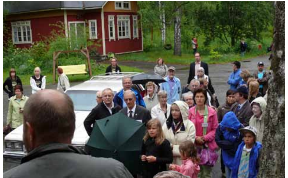
Suku kuunteli Kaisan Kaupan edessä tiikusteissa hievahtamatta...