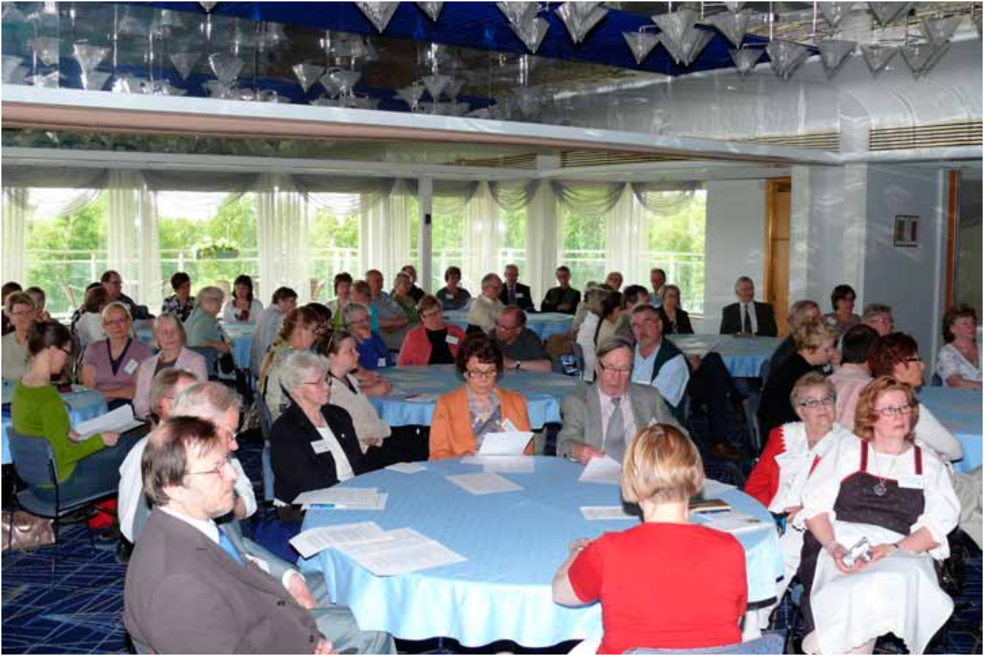
YHDESSÄ TAAS. Melkein sata sukulaista kokoontui hotelli Kimmelin kimaltavakattoiseen saliin.