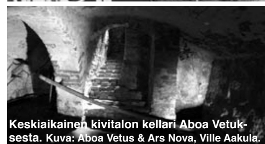
Keskiaikainen kivitalon kellari Aboa Vetuksesta.