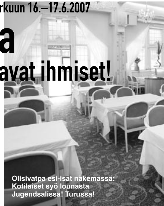
Olisivatpa esi-isät näkemässä: Kotilaiset syö lounasta Jugendsalissa! Turussa!

Sunnuntaina on lupa nauttia unesta, uinnista, saunasta ja kunnon hotelliaamiaisesta. Ripeämmät ehtivät ehkä lenkillekin. Sukuhaarat kokoontuvat palaverihinsa kello 11 sopimaan esimerkiksi sukuhaaran nimestä.