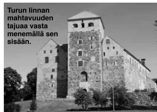
Turun linnan mahtavuuden tajuua vasta menemällä sen sisään.