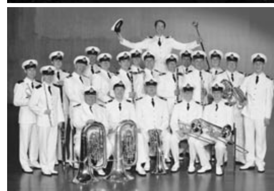
Timo ja Laivaston soittokunnan hilpeät veikot lupaavat iloisen läksiäiskonsertin.