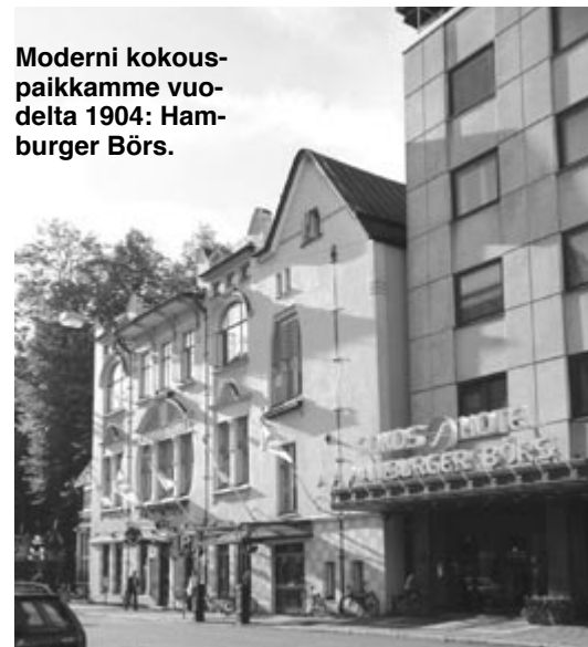
Moderni kokouspaikkamme vuodelta 1904: Hamburger Börs.